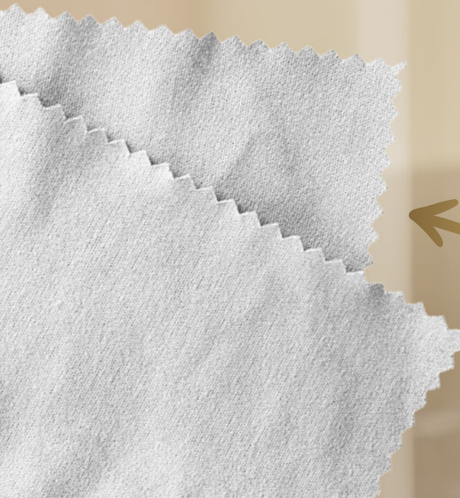
ściereczka z mikrofibry