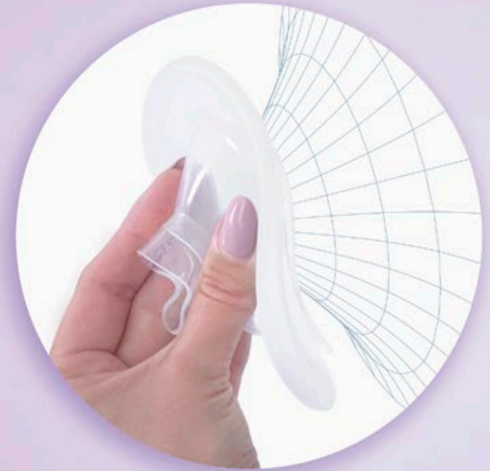
lejek 24 mm